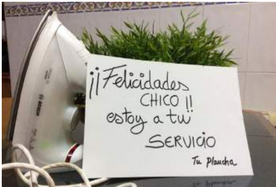
Ganadora del concurso municipal

En colaboración con el programa de coeducación, hemos participado en el concurso educativo de fotografía contra la violencia de género organizado por el Gabinete provincial de Asesoramiento sobre la Convivencia Escolar .