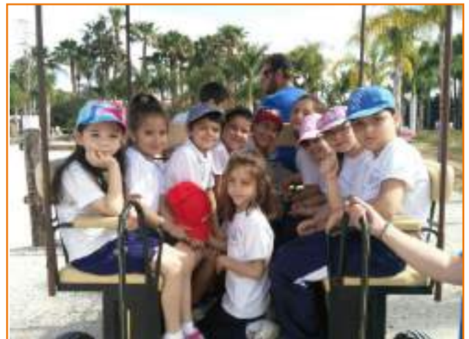
Visita a la Granja Escuela "El Pato"